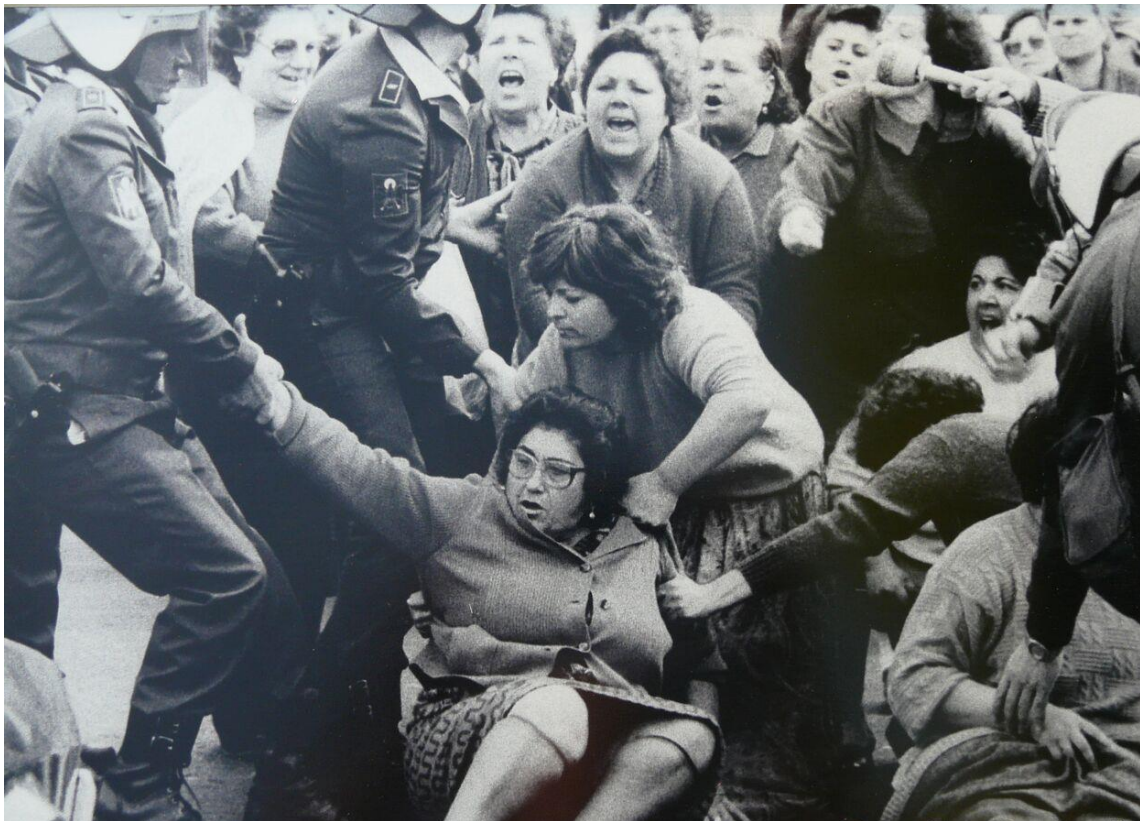
Mujeres enfrentándose a la Policía e intentando realizar una sentada.

Estas mujeres, sabían cuando zarpaban sus maridos, pero no si iban a volver. Ellas siempre fueron las más sufridoras, las más valientes y las más olvidadas.