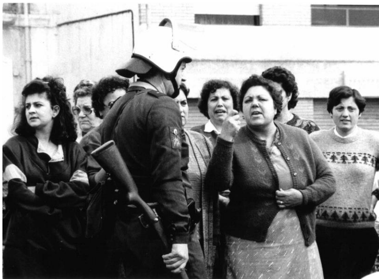
Mujeres enfrentándose y discutiendo con la Policía.

Quisiera dedicar un apartado a las mujeres de Pescadería. En los momentos que era necesario luchar para conseguir mejoras en los trabajos de sus maridos y padres ellas estaban las primeras para ayudar. Si se tenía que organizar alguna reunión, ellas estaban las primeras colocando las sillas. Si había cualquier manifestación eran las que preparaban las pancartas y las que más gritaban.