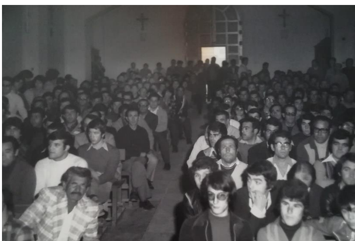
Reunión de pescadores en la Semana Santa de 1976 en la parroquia de San Roque.

Desoyendo al párroco, en Semana Santa de 1976 se ocupa la iglesia de San Roque. La reunión es un éxito. El boca a boca logra que cientos de interesado se aglomeren en el interior del edificio, y en las escaleras de este. Todas las personas debían situarse dentro, ya que si se encontraba una aglomeración de personas en la calle podría acudir la policía a dispersarlas, debido a que no estaba permitido el derecho de reunión, y de este modo la charla sería un fracaso. Finalmente se acordó en aquella asamblea más que charla que se realizaría una huelga en verano y los puntos que se exigirían en ella. 30