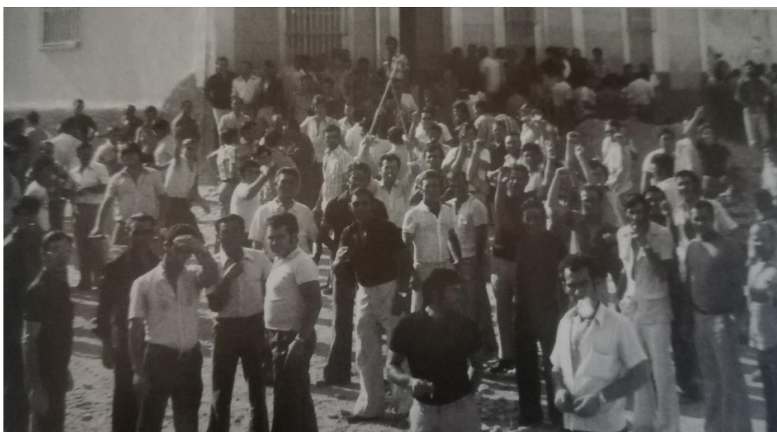
Huelguistas en la plaza de San Roque antes de una asamblea.

Las reivindicaciones presentadas fueron, partir los beneficios obtenidos de la actividad del barco en 12 partes iguales. Una parte para cada trabajador de los diez que van en cada barco. Y las dos restantes para el mantenimiento del barco y el armador, es decir, para el empresario y dueño del barco. Cuando anteriormente se dividía en 24, una para cada trabajador y las 14 restantes para el armador y el mantenimiento del barco. También se pidió un salario base de 25.000 pesetas, dos pagas extra, veinticuatro horas de descanso por cada semana trabajada, vacaciones y Seguridad Social para los trabajadores. 32