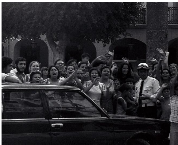
Manifestación de mujeres en la plaza Vieja de Almería, sede de la Alcaldía.

Las asambleas en la iglesia de San Roque se sucedían diariamente llegando a albergar a más de 600 personas. El día 21 los armadores llegaron a un acuerdo con algunas tripulaciones para que se hiciesen a la mar, pero los piquetes de huelga cerraron el puerto impidiendo que ningún barco saliese a faenar. 35