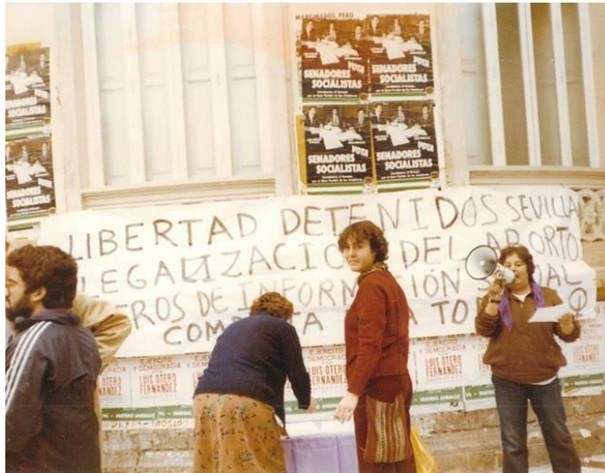
Recogida de firmas a favor de la despenalización del aborto y a favor de la puesta en libertad de las mujeres detenidas en Sevilla por tales prácticas. Plaza Juan Cassinello de Almería en 1980.