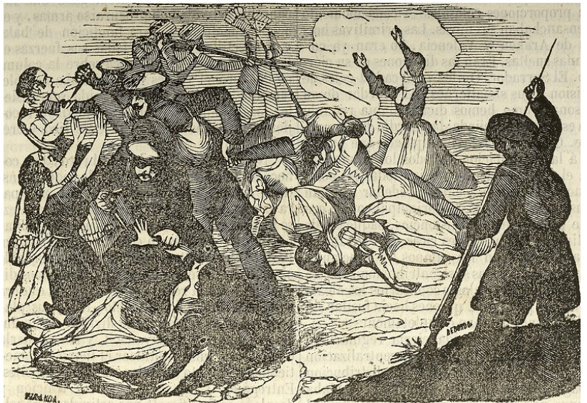
Fusilamientos. Venganza de Cabrera por el asesinato de su madre.

Los Isabelinos (o Cristinos por el nombre de la regente) eran apoyados por la un tanto extraña amalgama liberal que iba desde la Nobleza latifundista a las clases burguesas y medias, las ciudades más importantes (incluso en Vascongadas-Navarra) y un ejercito que había cambiado mucho a raíz de la guerra de la independencia. Tuvo el apoyo internacional a través de la firma de la Cuádruple Alianza (Francia, Gran Bretaña, Portugal y España)