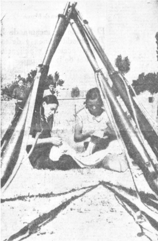
Alto el fuego! Cesó el tableteo de las ame tralladoras; terminó el estallido de los obuses. Y aquí tienen ustedes a estas valientes muchachas cosiendo la ropa de sus hermanos, los caballeros de las milicias