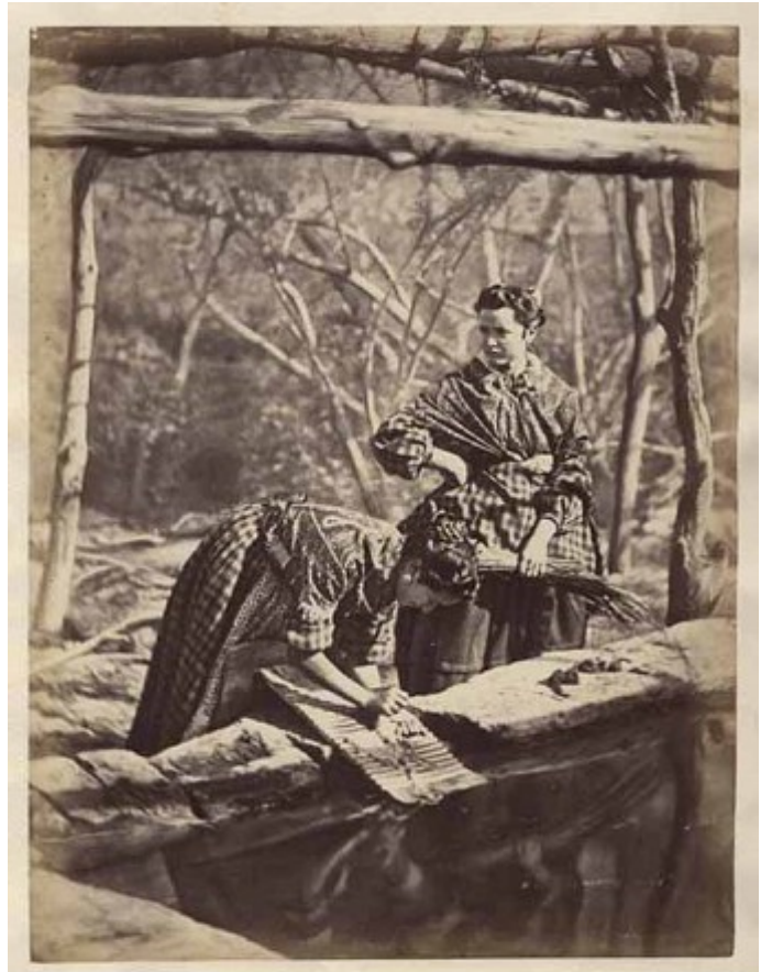
Lavanderas. Córdoba c1870. Laurente.