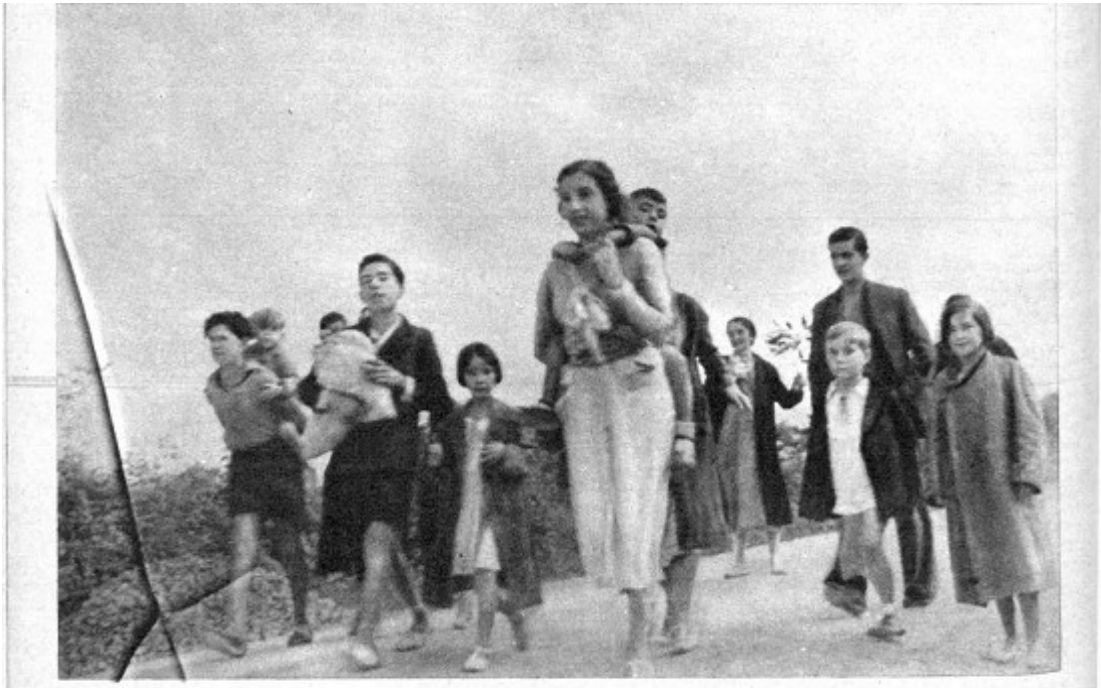
Mundo Gráfico. 24-10-1934. Oviedo. Huyendo de los combates. Revolución de Octubre