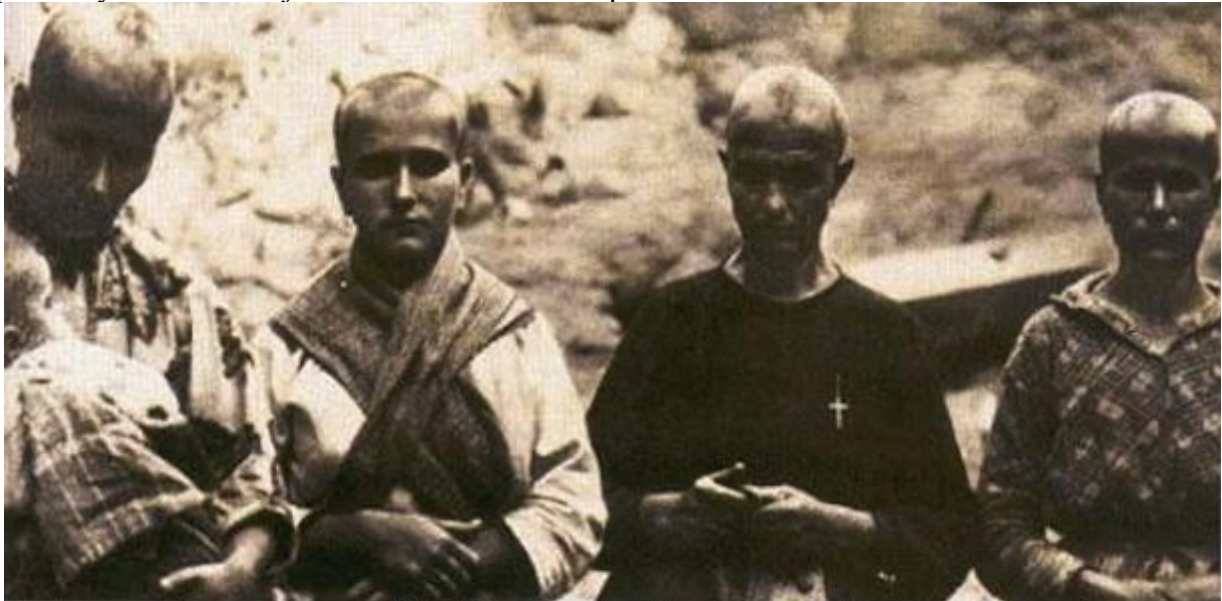
Mujeres rapadas en Oropesa (Toledo) por ser familiares de republicanos.

8. Un profundo machismo deshizo toda la legislación de derechos de la mujer aprobada por la república y sitúa a la mujer como menor de edad perennemente sometida al varón.