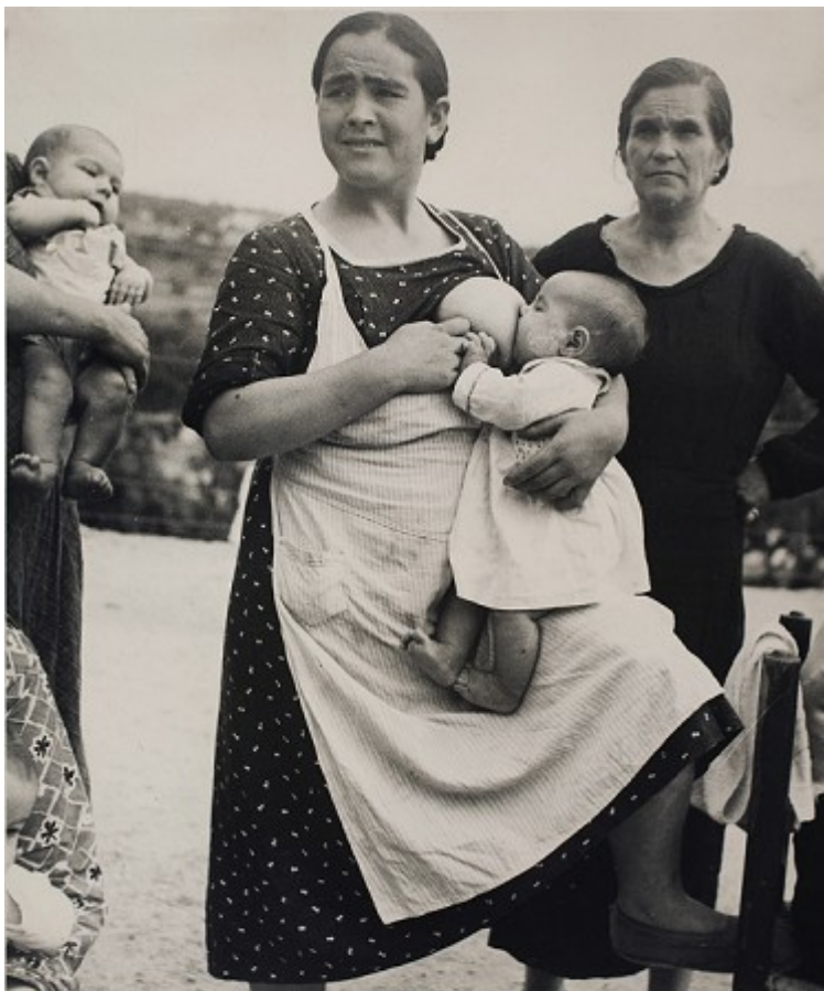
Mujer dando de mamar. Del reportaje Gráfico hecho por Kati Horna en la Casa de la Maternidad de Veléz-Rubio. 1937.

menos: Se parte de casi cero y también hay que tener cuidado de que los temas sigan sirviendo para selectividad 2 . Además el temario de selectividad es bastante deficiente para una comprensión de los procesos históricos de base y está innecesariamente enmarañado con excesiva atención al mareante vaivén de la truculencia gubernamental.