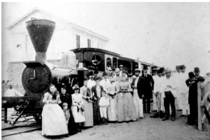
1885. Ferrocarril Manila-Dagupan.

http://www.viruseditorial.net/pdf/TClaramunt.pdf Página vista 31 de diciembre de 2013. Puedes escoger entre leer algunos de ellos o leer la biografía.