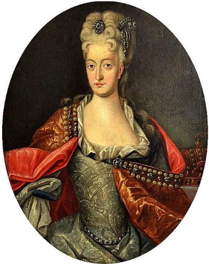
Elisabet Cristina de Brunsvic-Wolfenbüttel Gobernadora de Cataluña 1711-13

Puedes bajarla también en facsimil pdf y formatos ebook .Materiales complementarios.