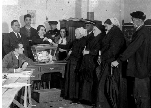
Eibar. 1933. Votación del estatuto vasco.

Pero, como en otros aspectos, la extensión de los cambios dejaba que desear. Y el paso atrás del bienio negro y la supresión de la experiencia republicana por la sublevación, guerra y dictadura que le siguió nos retrotraía a una pésima situación.