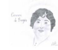
Carmen de Burgos, Colombine