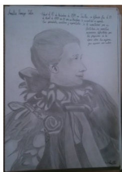
Amalia Domingo Soler