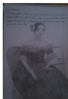
Luisa Fernanda de Borbón