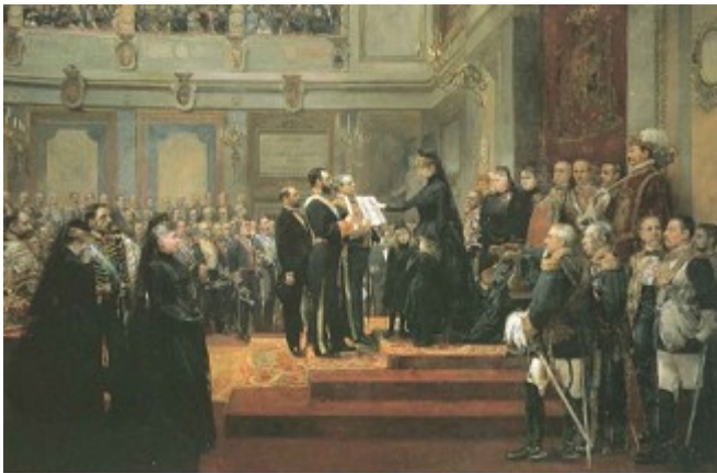
María Cristina. Jura la Constitución de 1876 en 1885 al asumir la regencia.