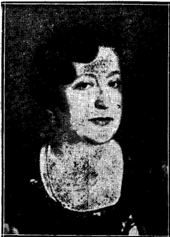
La ilustre escritora y periodista Carmen de Burgos, autora de obras literarias de extraordinario éxito La Libertad. 25/5/1932, página 3.

La "Unión Obrera" de Flora Tristán. Emancipación feminista y social en 1843 y hoy. Resumen de la fundamental obra de Flora Tristán y valoración de su importancia histórica y actual. Tiene un bibliografía de la autora, indicando su acceso por Internet y algunas para su utilización en la enseñanza secundaria.