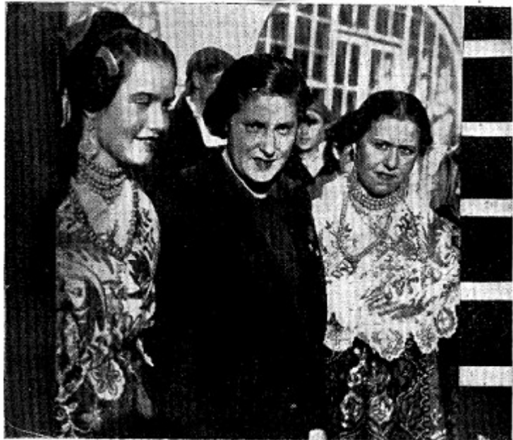
Pilar Primo de Rivera, acompañada de dos señoras de Falange Española Tradicionalista y de las JONS, que asisten al Congreso Femenino de Zamora, ataviadas con los trajes típicos de su región.

Tras los sucesos de mayo el papel de la mujer se ciñó más a labores de apoyo en la retaguardia y la labor propiamente feminista quedó circunscrita a aspectos culturales, si bien se conservaron o ampliaron los espacios legales conquistados en la república.