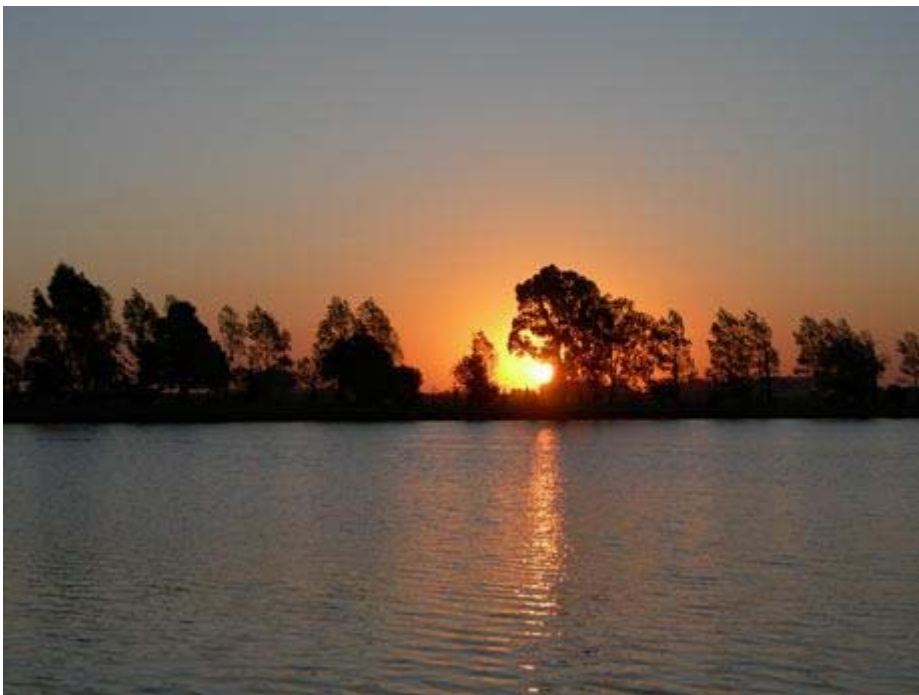
La soledad del lago