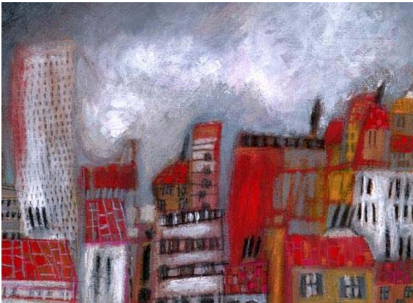
Los lugares comunes

Algunos de sus poemas se han publicado en la antología Cima de olvido. Cinco poetas jóvenes de Jaén (Diputación Provincial de Huelva, 2006), en las revistas Adarve, Aldaba, Hwebra y La sombra del membrillo, así como en los volúmenes colectivos !A ti, Gran Duquesa! y otros poemas (Madrid, Ediciones de la UAM, 2003) y Vegetales y otros poemas (Madrid, Ediciones de la UAM, 2004). Es coeditora de Adarve, Revista de crítica y creación poética, que se publica en Internet desde enero de 2006, y colaboradora de la revista Paraíso.