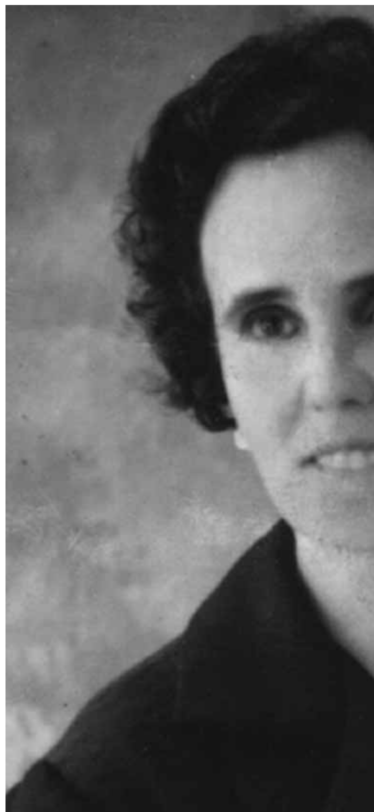
CARTEL Lola ha querido tener un detalle con su abuela.