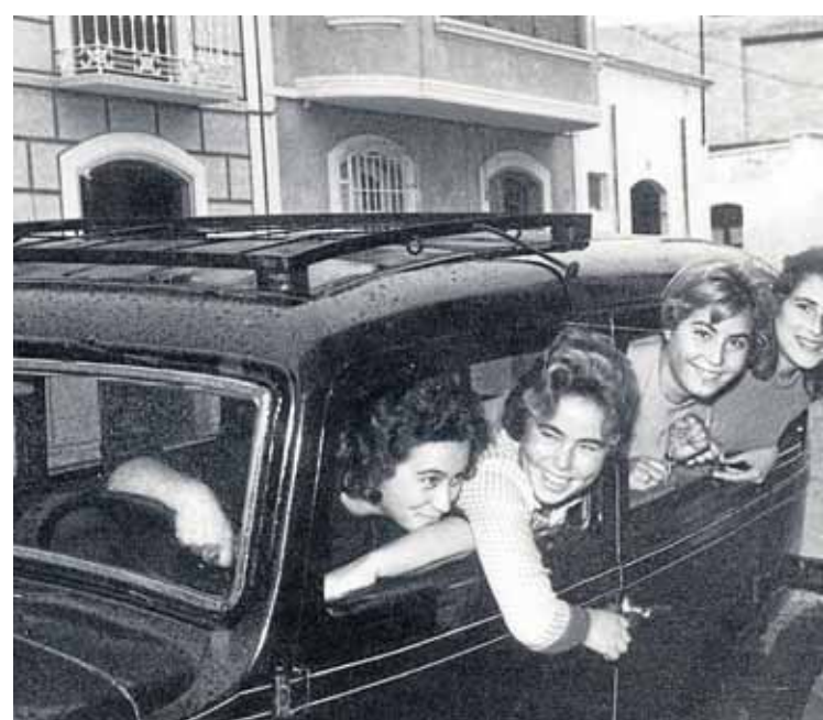
PANDILLAS Un grupo de amigas veratenses. LA VOZ