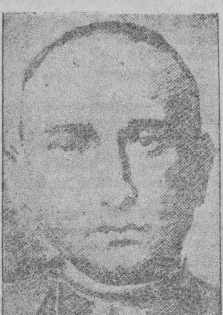
El Cardenal Mindszenty, víctima del comunismo ateo.

pero no intentaba tampoco librar una batalla contra la influencia del Vaticano en otros países católicos. Ahora, las cosas han cambiado.