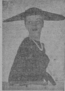
MODELO DE DIOR

El "tailleur" de noche, que hizo su aparición en esta temporada, toma ahora una mayor importancia.