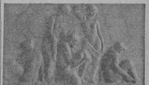
Uno de los relieves en piedra del país, por Jaime Mir.

mo escultor Jaime Mir. En dos de estos relieves van plasmados dos escenas que simbolizan las dos facetas de la interesante personalidad del Archiduque en sus aspectos apolíneo y uloníaco y en los otros dos se reproducen, siempre simbólicamente, clara está, el momento del descubrimiento de Mallorca por el viajero errante que fué el Archiduque, y la elección de la isla como refugio y patria predilecta. Reconozco que es muy difícil y comprometido plasmar diversos aspectos biográficos de un personaje como el Archiduque sin caer en lo chabacano o en lo banal. Jaime Mir ha resuelto la paleta con un fino y una discreción extraordinarias. Plásticamente, la obra es irreprochable; Mir es uno de aquellos escultores que se hallan en la línea de la tradición más pura, aunando las exigencias plásticas con la más noble fidelidad al cuerpo humano desnudo, tal como nos la transmitió Grecia y supo conservarla el Renacimiento gracias al mecenazgo de los Papas de la