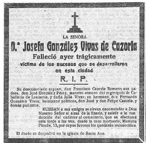
La Gaceta del Sur. Granada. 12 de febrero de 1919, Pág. 2