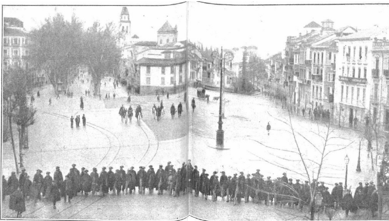
Plaza granadina denominada el Embovedado, tomada militarmente por las fuerzas de la Guardia civil durante los sucesos acaecidos en los días 11 y 12 del actual