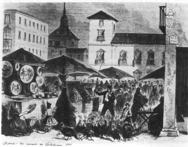
Mercado navideño en las inmediaciones de la Plaza de la Santa Cruz de Madrid hacia 1869. Carlos Plá et al. El Madrid de Galdós, El Avapiés Madrid, 1987.

Grabado-dominación del mercado navideño instalado en las inmediaciones de la Plaza de la Santa Cruz de Madrid hacia 1869.