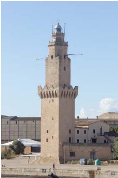
Faro y Torre de Señales de Porto Pi. Palma de Mallorca.

Grabado-dominación del mercado navideño instalado en las inmediaciones de la Plaza de la Santa Cruz de Madrid hacia 1869.