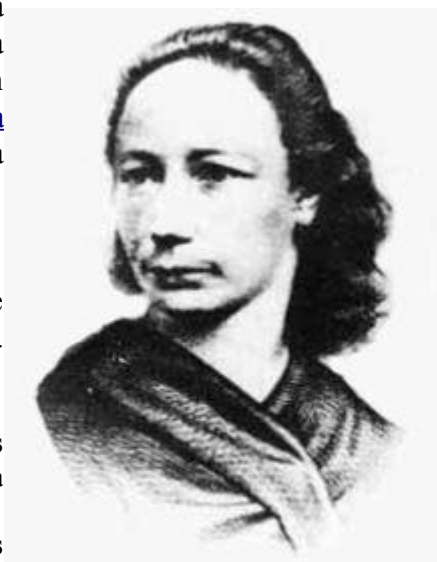
Louise Michel (1830-95).