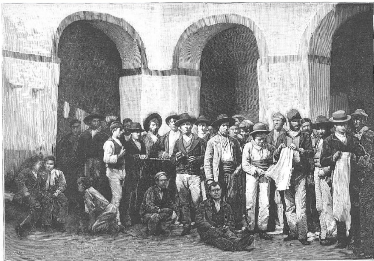
CÁRCEL DE JEREZ.—GRUPO DE PRESOS ACUSADOS DE COMPLICIDAD EN LOS CRÍMENES COMETIDOS POR LA ASOCIACION ANARQUISTA.

Entremos en la cárcel. Ni una fisonomía de rasgos salientes, de esos que denotan un rayo de