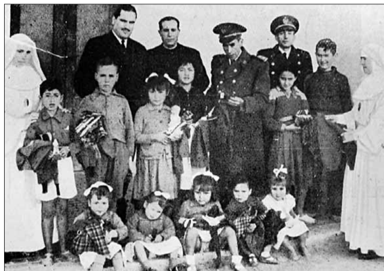
■ El director de la Prisión de Almería, con un grupo de hijos de reclusos tras hacerles entrega de obsequios con motivo de una visita a sus padres.

Así se desprende de la documentación que han analizado y reunido en el censo digital ‘600 mujeres. La represión franquista de