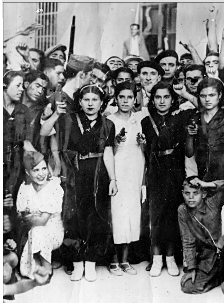
■ Foto que sirve de portada a la publicación. Hombres y mujeres de Almería celebran la