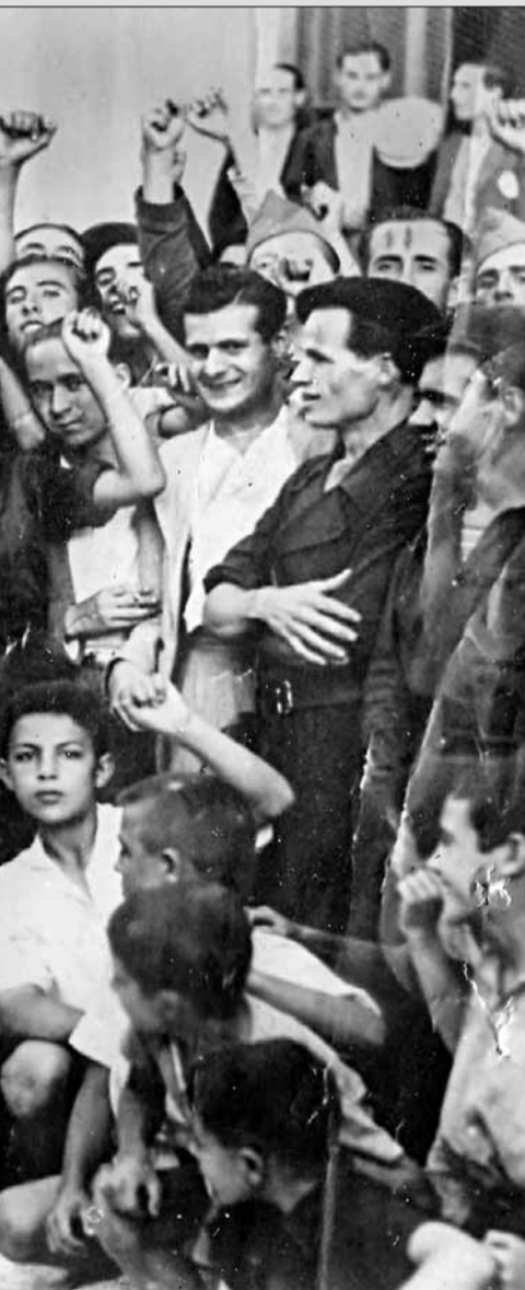
derrota de los sublevados en julio del 36. / LA VOZ

De las 600 mujeres analizadas en el censo del Instituto de Estudios Almeriense, casi ninguna fue condenada a la pena capital. La excepción, Encarnita Magaña, fusilada en el año 1941.